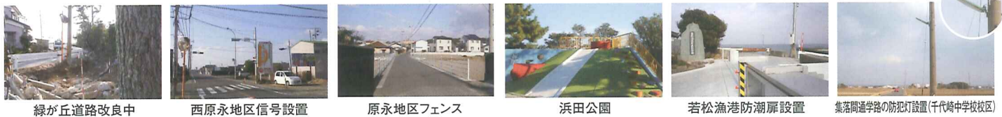
緑が丘道路改良中